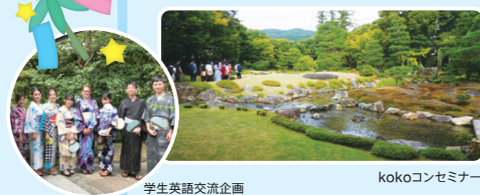
学生英語交流企画