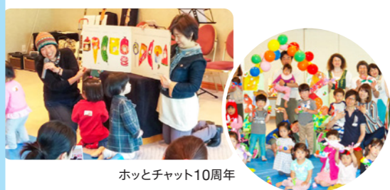
ホットチャット10周年