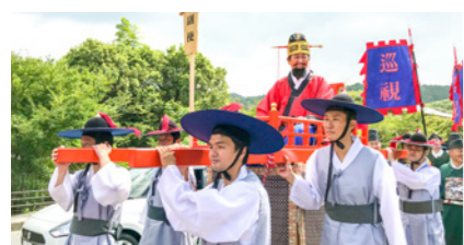
コリアフェスティバル