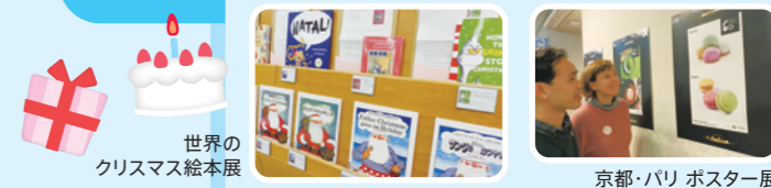
世界のクリスマス絵本展