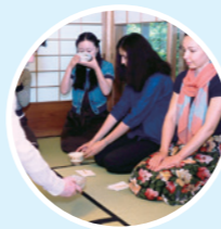
はじめてのお茶 お茶会