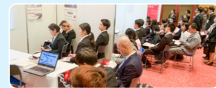
WORKS JAPAN × kokoka JOB FAIR