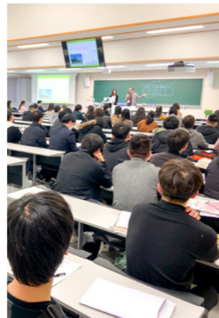
ウェルカムパッケージ