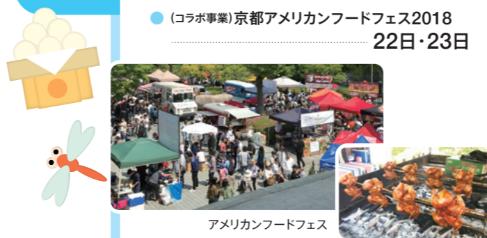
アメリカンフードフェス