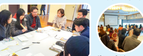
グローバルセッション