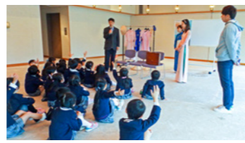
社会見学 受け入れ事業