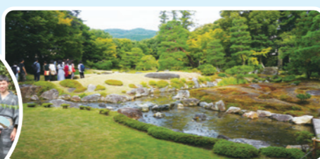
kokoコンセミネーター