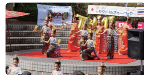
日・タイ・カルチャーフェア