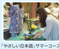
「やさしい日本語」サマーコース