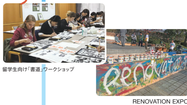
留学生向け「書道」ワークショップ