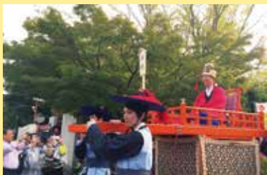
京都コリアフェスティバル2016