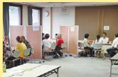
カウンセリング・デイ