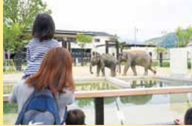
子育てステーションホットチャット