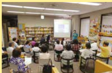
ロングステイセミナー