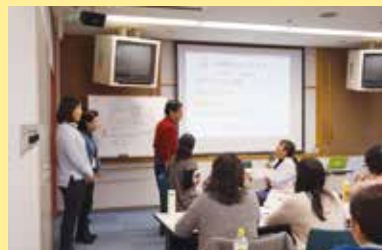
医療通訳者養成講座