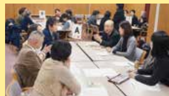
連続フォーラム「チョゴリときもの」