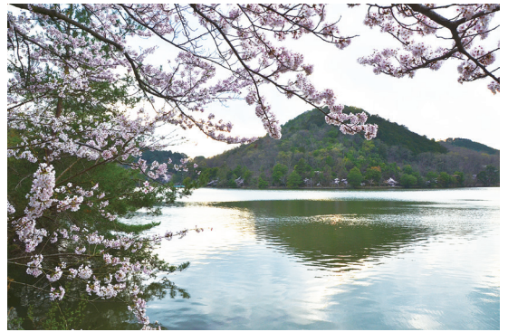
たからがいけこうえん まくら 宝ヶ池公園の桜

おそらくあなたは彼らに嫌われてしまうでしょう。鹿も同じです。彼らも鯉と同じ態度で人間に接します。でも、この公園では、鹿はほとんど見かけることはありません。彼らは奈良の鹿とは違い、内気で、新しい仲間を作ることを好みません。実際、私もほとんど鹿を見かけたことはなく、一度だけ彼らの群れに出くわしたことがあるだけです。私の帰宅が遅かったときで、暗かったので、たいへんな経験でした。彼らは私に驚き、私は彼らに驚いたのですから。