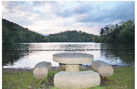
ゆうぐ たからがいけ 夕暮れの宝ヶ池

また、昨年私と仲良くなろうとした一匹の生意気な鹿がいました。でもその鹿にはそれ以降会っていません。おそらく彼は結婚し、うろつく時間がなくなったか、もしくは人間と友達になることをあきらめたのでしょうか。