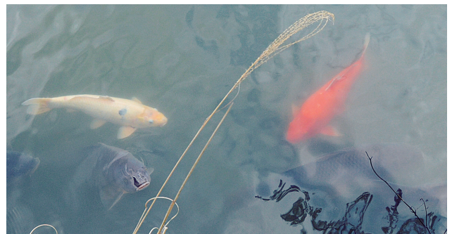
餌を欲しががる鯉