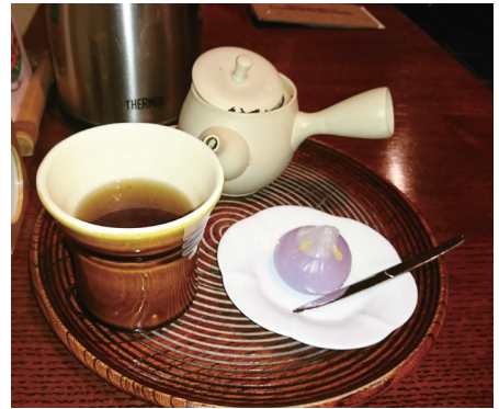
ほうじ茶と和菓子

みな にはん き ちや の がつ 皆さんは日本に来てお茶を飲んだことがありますか？5月～ が つ しんちや きせつ いちばん じ き きょうと 7月は新茶の季節で、お茶が一番おいしい時期です。京都には うじちや ゆうめい ちや 宇治茶という有名なお茶があります。「公益社団法人 京都府茶業 かいぎしよ うじちや きょうと なら し が み え さん 会議所*1」によると、宇治茶は京都・奈良・滋賀・三重の四 ふけんさんちや きょうとさん さいゆうせん きょうとふない きょうしや ふない しあ 府県産茶（京都産が最優先）を、京都府内の業者が府内で仕上げ かこう うじちや しずおかちや さやまちや にほんさんだいちや 加工しています。宇治茶は静岡茶、狭山茶と並んで「日本三大茶」 きょうとふない うじ うじたわら わづか やましろ といわれています。京都府内では、宇治、宇治田原、和東、山城 おも うじちや さんち よだん うじ しずおか しやうがっこう が主な宇治茶の産地です。余談ですが、宇治や静岡の小学校では、 ちい ちや した 小さいころからお茶に親しんでもらうために、ひねるとお茶が出 てくる蛇口があります。また、お茶について学ぶ授業もあります。