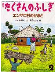
エンザロ村のかまど