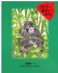
ゴリラとあかいぼうし