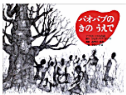
バオバブのきのういで