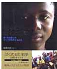
戦争が終わっても