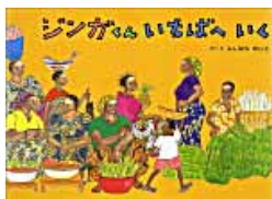
ジンガくんにいしばへいく